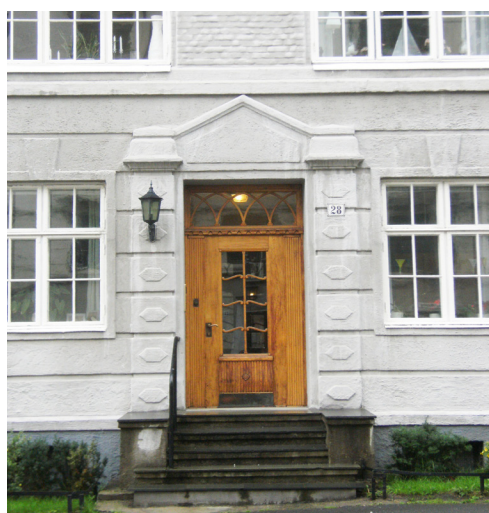
Over, Erling Skjalgssons gate 28 (ca. 1920) og t.h. Oscars gate 43, (1899). I begynnelsen av 1920-årene ble porter og dører med kun én midtstilt dør vanlig. Sidepartiene var da utført med skåter, slik at større gjenstander kunne få passasje.

Dersom en kopi er eneste mulighet, er det viktig at denne lages så nøyaktig som mulig. Man bør ikke falle for fristelsen til å forenkle det opprinnelige uttrykket; da mister kopien mye av sin verdi. Porten eller døren vil med gode materialer og godt vedlikehold fint kunne stå i mer enn 100 år. Det er i dét perspektivet økonomien og beslutningene om dørutformingene bør vurderes. Husk også å flytte over eldre gangjern, låsbeslag og dørvidere. Disse kan enkelt pusses opp. Det vil være med på å gi den nye kopien et mest mulig autentisk uttrykk, og skape sammenheng med arkitekturen for øvrig.