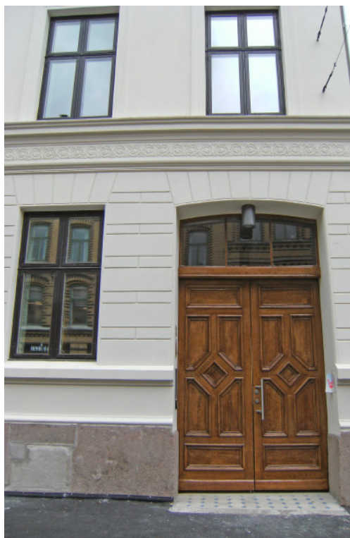
Pilestredet 30A fra 1860, har fått tilbakeført inngangsporten til ådret utførelse