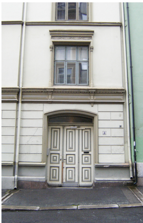
Peder Claussøns gate 3, oppført 1873, har uoriginal fargesetting.

Fasadetegningene var ofte tegnet uten at dørens detaljering ble vist, så her er det dessverre muligheter for å bli skuffet. En tur i nabolaget vil kunne føre til at en tilsvarende utformet port finnes. Da kan man enkelt kopiere og tilpasse detaljene. Plan- og bygningsetaten kan ha aktuelle byggemeldingstegninger i original eller kopi. Opprinnelige originaltegninger kan også finnes i Byarkivet. For å få tilgang der, må man få henvisning fra Plan- og bygningsetaten. Historiske foto kan finnes følgende steder; Byarkivet, Riksantikvaren, Oslo Bymuseum, Fortidsminneforeningen; Oslo- og Akershus avdeling, Norsk Folkemuseum og Nasjonalbiblioteket. Byarkivet og Nasjonalbiblioteket har fotosamlinger på internett – se web adresser nedenfor.