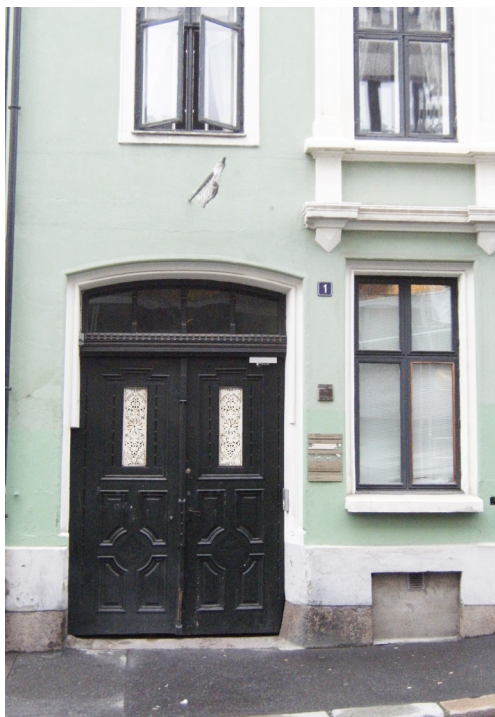
Peder Claussons gate 1, (1873), har en porttype som ble mer vanlig fra 1880-årene, oftest med en høyere overdel, gjerne gjennombrutt og en mindre underdel utformet som en brystning.