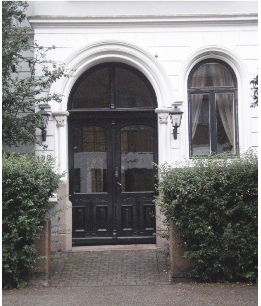
Camilla Colletts vei 5 (midten av 1890-årene) har beholdt sine opprinnelige inngangsdør med dekorative glass med etsed motiv. Camilla Colletts vei 12B (ca. 1902)